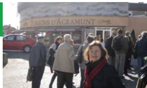
Visita a Torrons d'Agramunt (23-11-12)