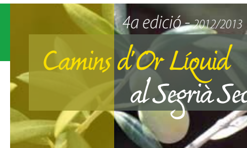
Camins d'or líquid al Segrià Sec (6-11-12)