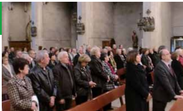
Festa St. Crist Balaguer (13·11·11) Assistents Missa a l'Església de Sant Ramon de Penyafort