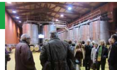
Visita a Costers del Sió (23-11-12)