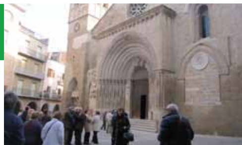
Visita a Santa Maria d'Agramunt (23-11-12)