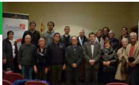
Presentació centre desenvolupament rural integrat de Catalunya (11·12·12) Fotografia grup d'assistents a la Presentació de Cedricat