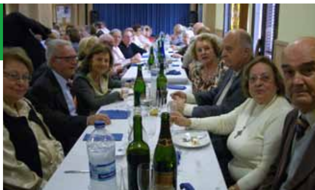
Festa St. Crist Balaguer (13·11·11) Assistents dinar de germanor