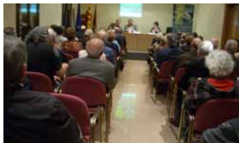
Consell Comarcal del Segrià - Acte de presentació del projecte Camins d'or líquid al Segrià Sec (6-11-12) Sala d'actes