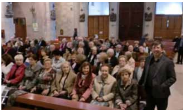
Festa St. Crist Balaguer (18·11·12) Cantada Coral Terra Ferma