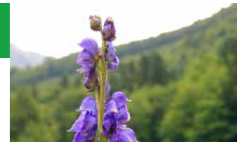
Mostra de Fotografies de Maria Osiàs (16-10-12) Tora blava