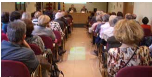
Festa St. Crist Balaguer (13·11·11) Sala de conferències