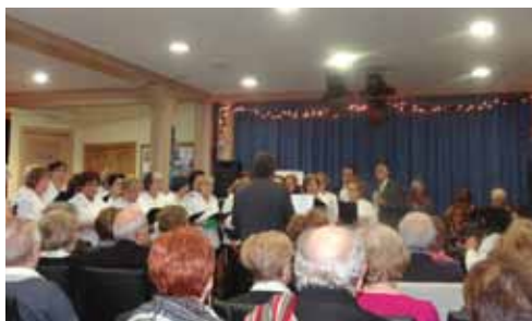
Cantada de Nadales de la Coral Terra Ferma amb el Grup d'Acordionistes del Centre (16·12·12)