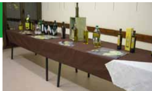
Camins d'or líquid al Segrià Sec (6-11-12)