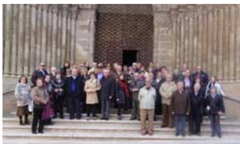
Grup Associats. Excursió Agramunt (23-11-12)